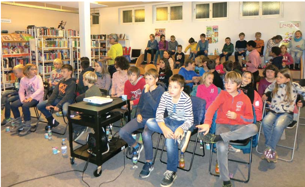
40 Kinder folgten der Einladung der Stadtbibliothek zur langen »Nacht ab 8« am 30. Oktober mit dem spannend-gruseligen Kinofilm »Die Gespensterjäger« von Cornelia Funke. Der Ferienstart wurde so gebührend mit allerlei Naschwerk und Getränken von der Süßkrambar gefeiert.