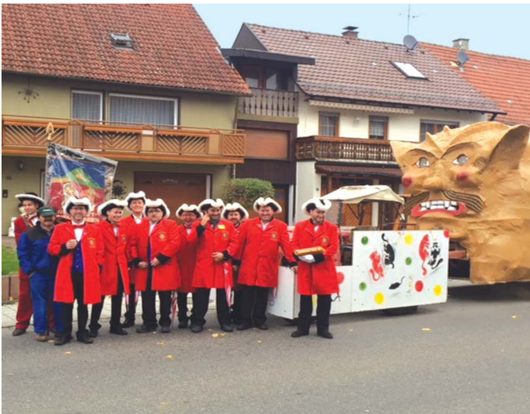
Mit dem Festwagen vom Narrentreffen 2016 fuhr der Elfer-Rat mit dem Fähnrich durch das Rollidorf Welschingen, um an die Kinder, die an der Straße warteten, Süßigkeiten zu verteilen.

Außerdem wird das Sportabzeichen an die Teilnehmer verliehen, und die Turnerjugend bekommt Besuch von Nikolaus und Knecht Rupprecht.